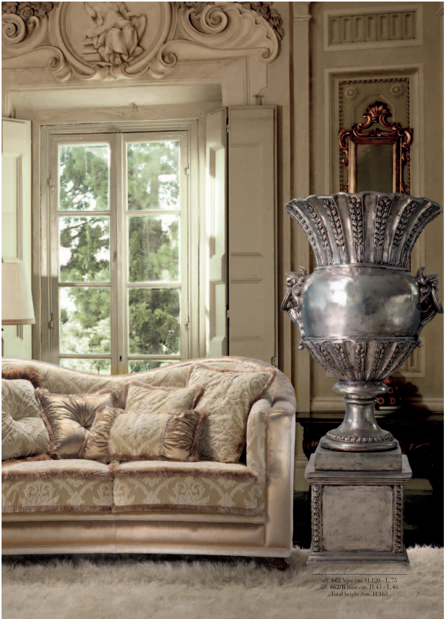
art. 662 Vase cm. H.120 - L.75 art. 662/B Base cm. H.43 - L.46 Total height: cm. H.163