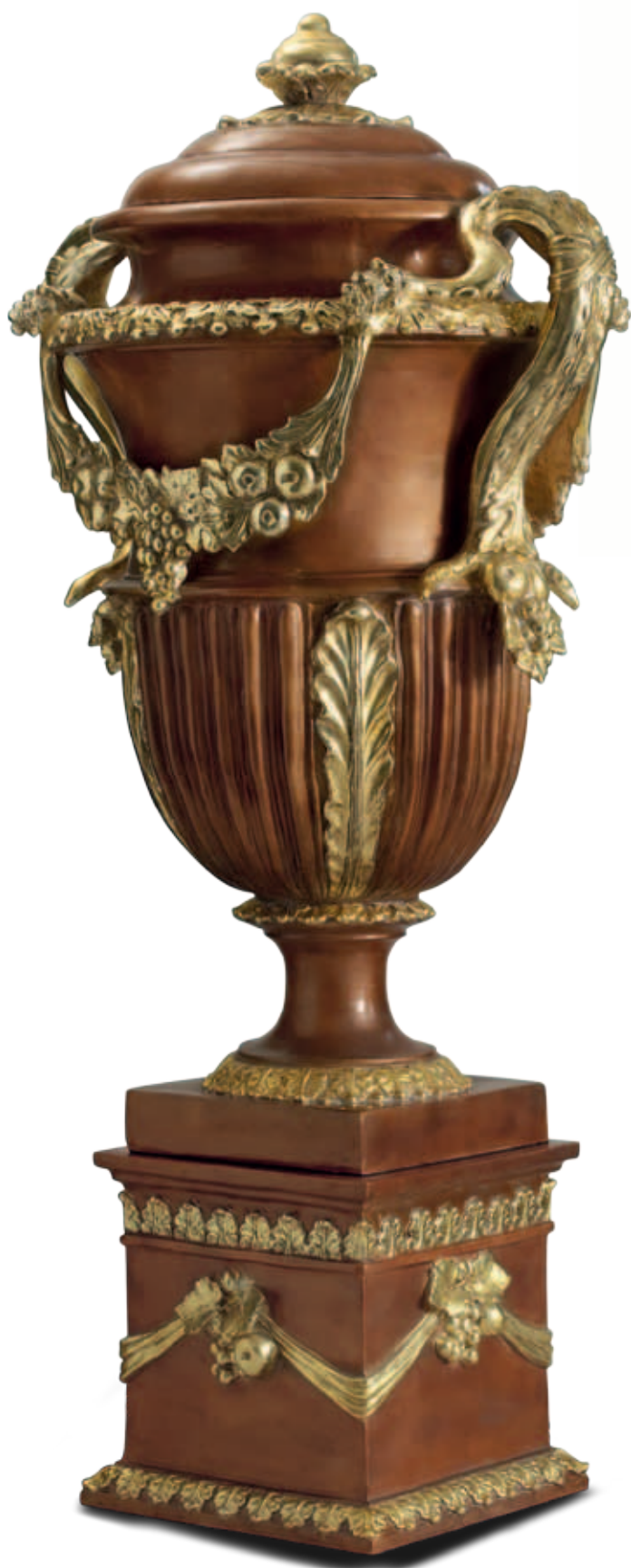
art. 627 Vase cm. H.155 - L.100 art. 627/B Base cm. H.48 - L.50 Total height: cm. H.203