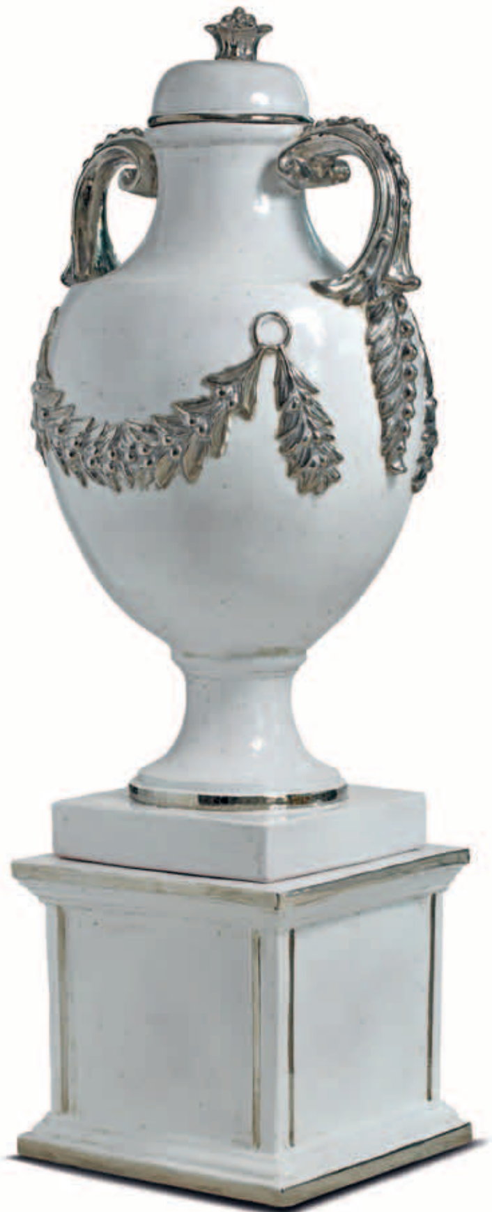
art. 477 Vase cm. H.120 - L.60 art. 477/B Base cm. H.43 - L.48 Total height: cm. H.203