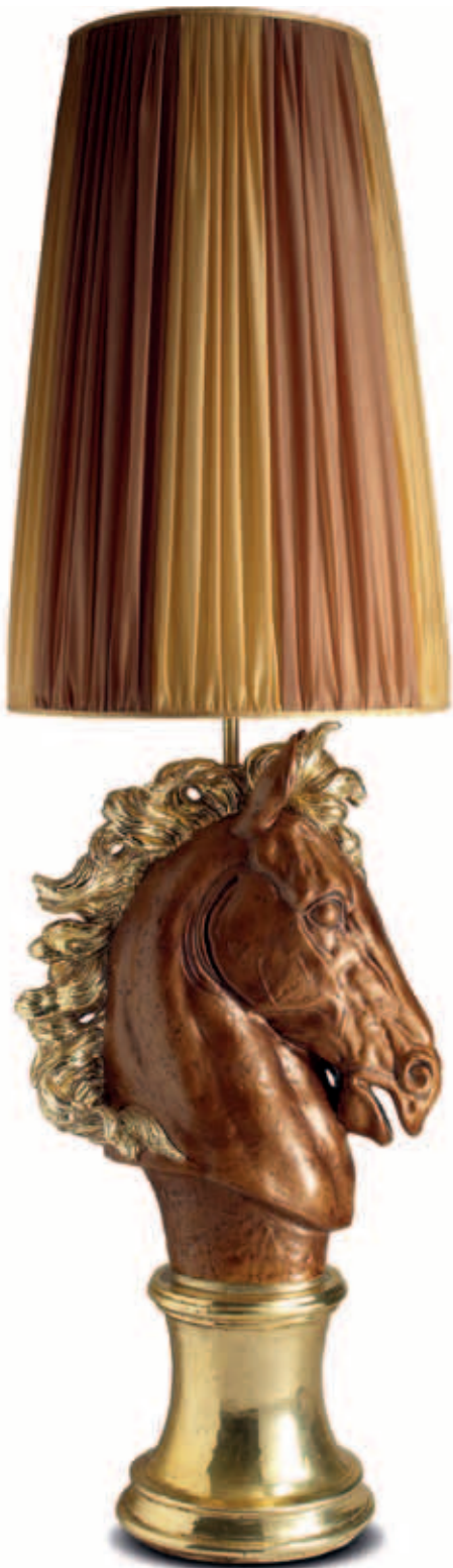
art. 525 Horse head cm. H.107 - L.60 Total height: cm. H.205

The use of fine materials and a meticulous handcrafted attention for details have always been an unmistakable sign of the quality brand.