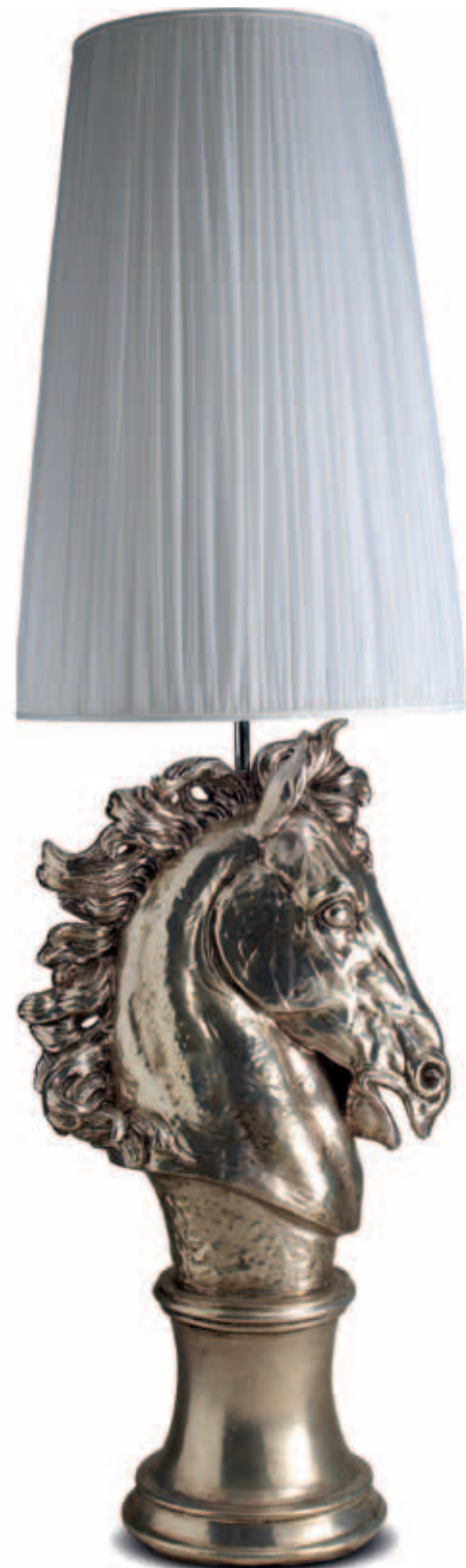
art. 525 Horse head cm. H.107 - L.60 Total height: cm. H.205