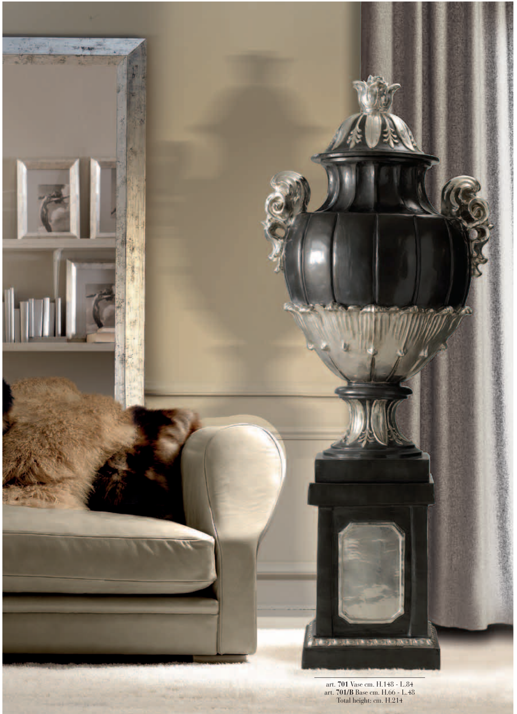
art. 701 Vase cm. H.148 - L.84 art. 701/B Base cm. H.66 - L.48 Total height: cm. H.214