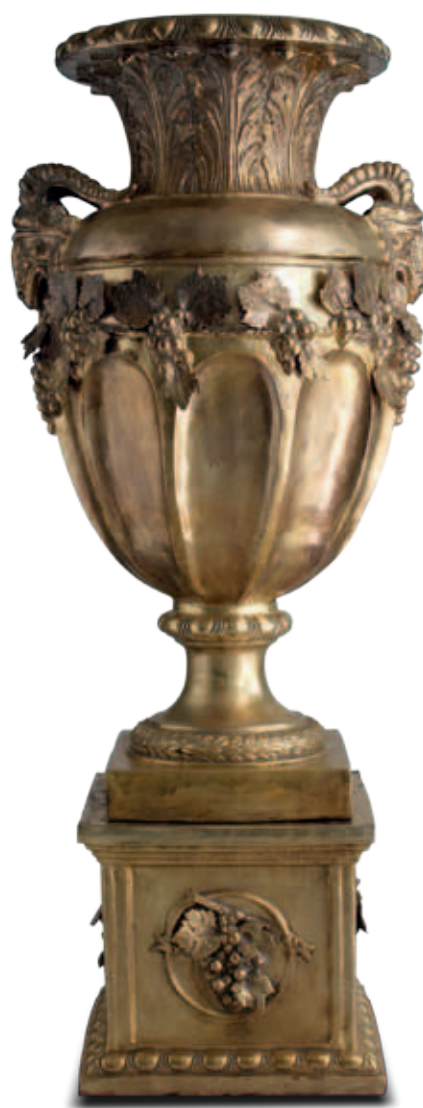
art. 615 Vase cm. H.160 - L.80 art. 615/B Base cm. H.43 - L.48 Total height: cm. H.203