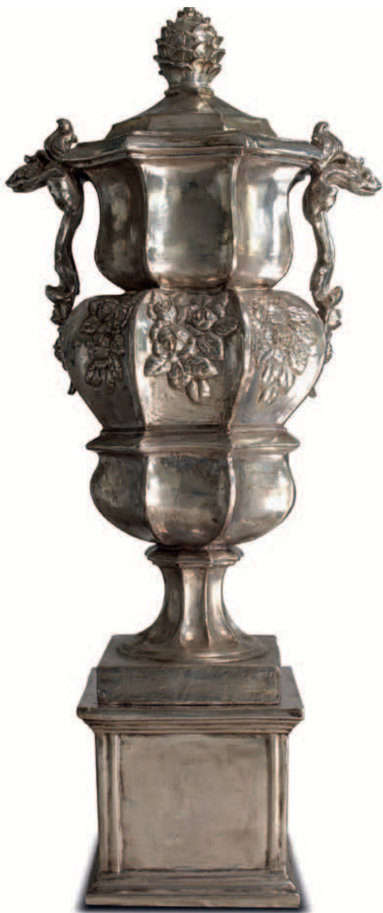
art. 670 Vase cm. H.153 - L.90 art. 670/B Base cm. H.43 - L.46 Total height: cm. H.196

It is the synergy of tradition and innovation that provides the very special, unmistakable Ceramiche Ceccarelli touch. With our broad product line and the topquality mixture of styles, we create timelessly beautiful spaces in which people are simply happy. Our creations awaken la dolce vita and the Italian lifestyle.