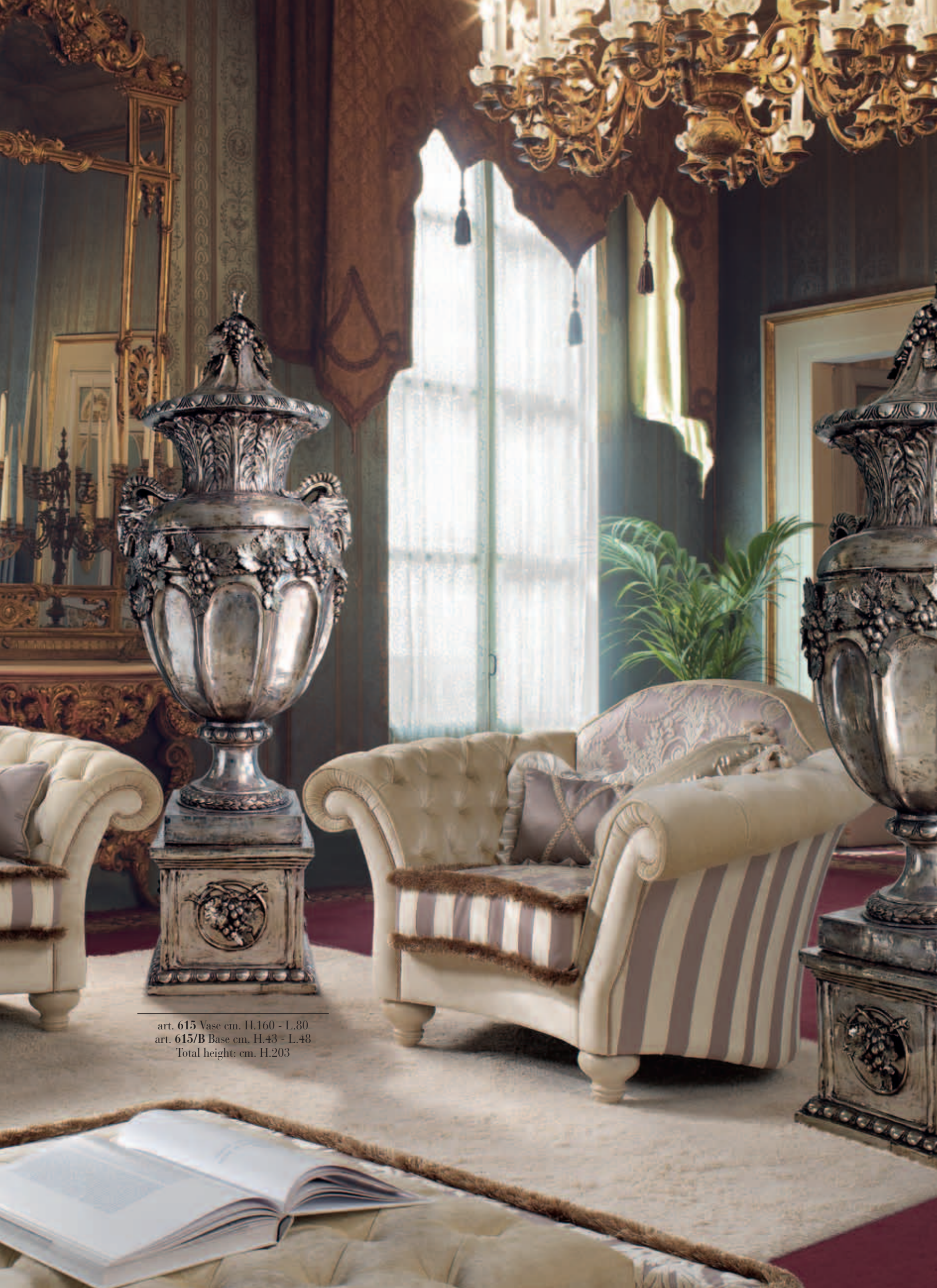
art. 615 Vase cm. H.160 - L.80 art. 615/B Base cm. H.43 - L.48 Total height: cm. H.203