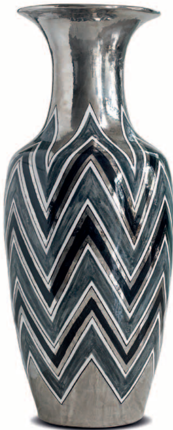
art. 705 Vase cm. H.126 - L.50