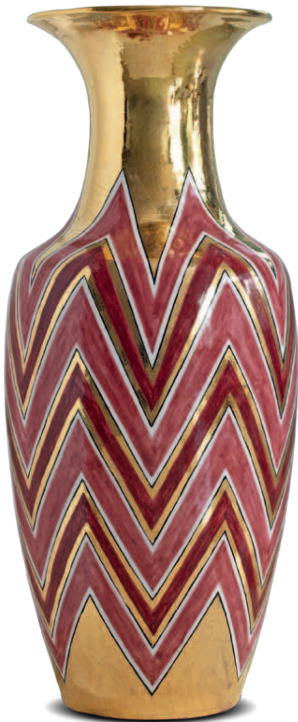
art. 705 Vase cm. H.126 - L.50