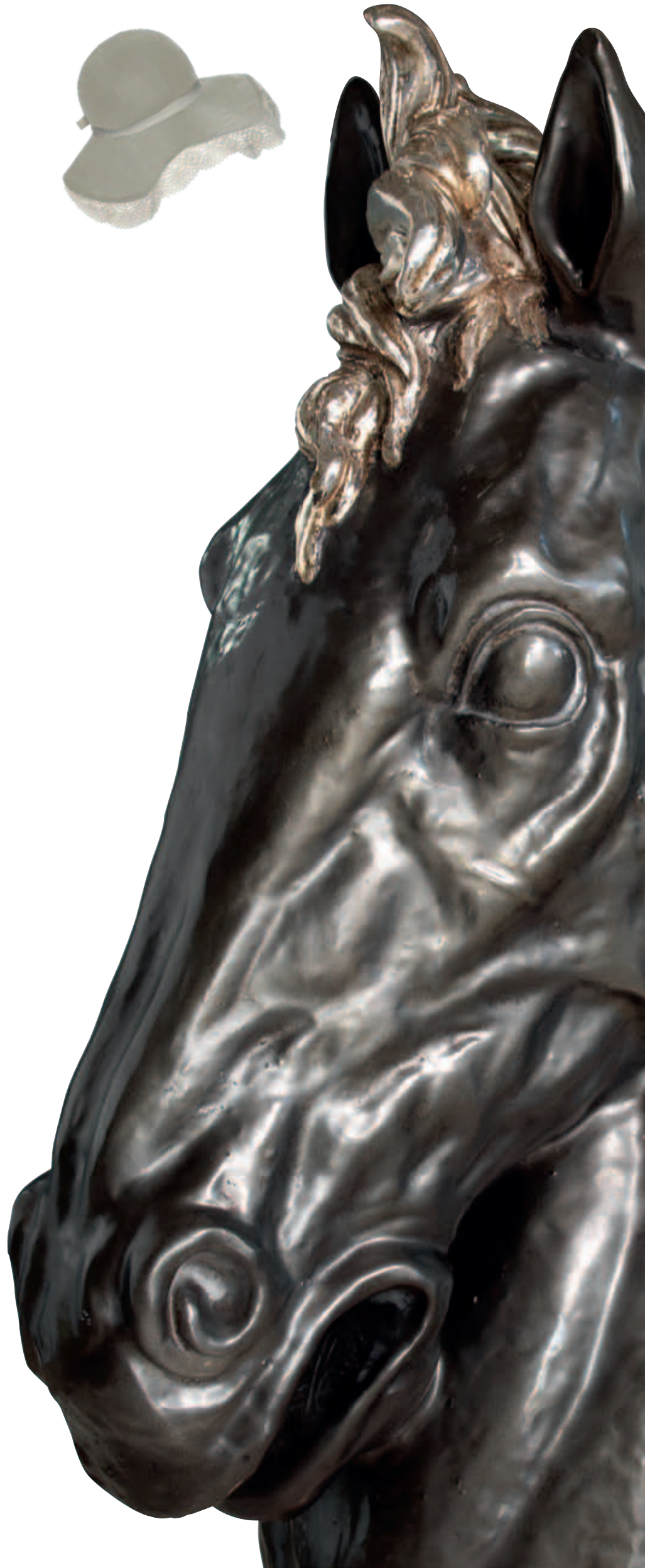
art. 525 Horse head cm. H.107 - L.60 Total height: cm. H.205