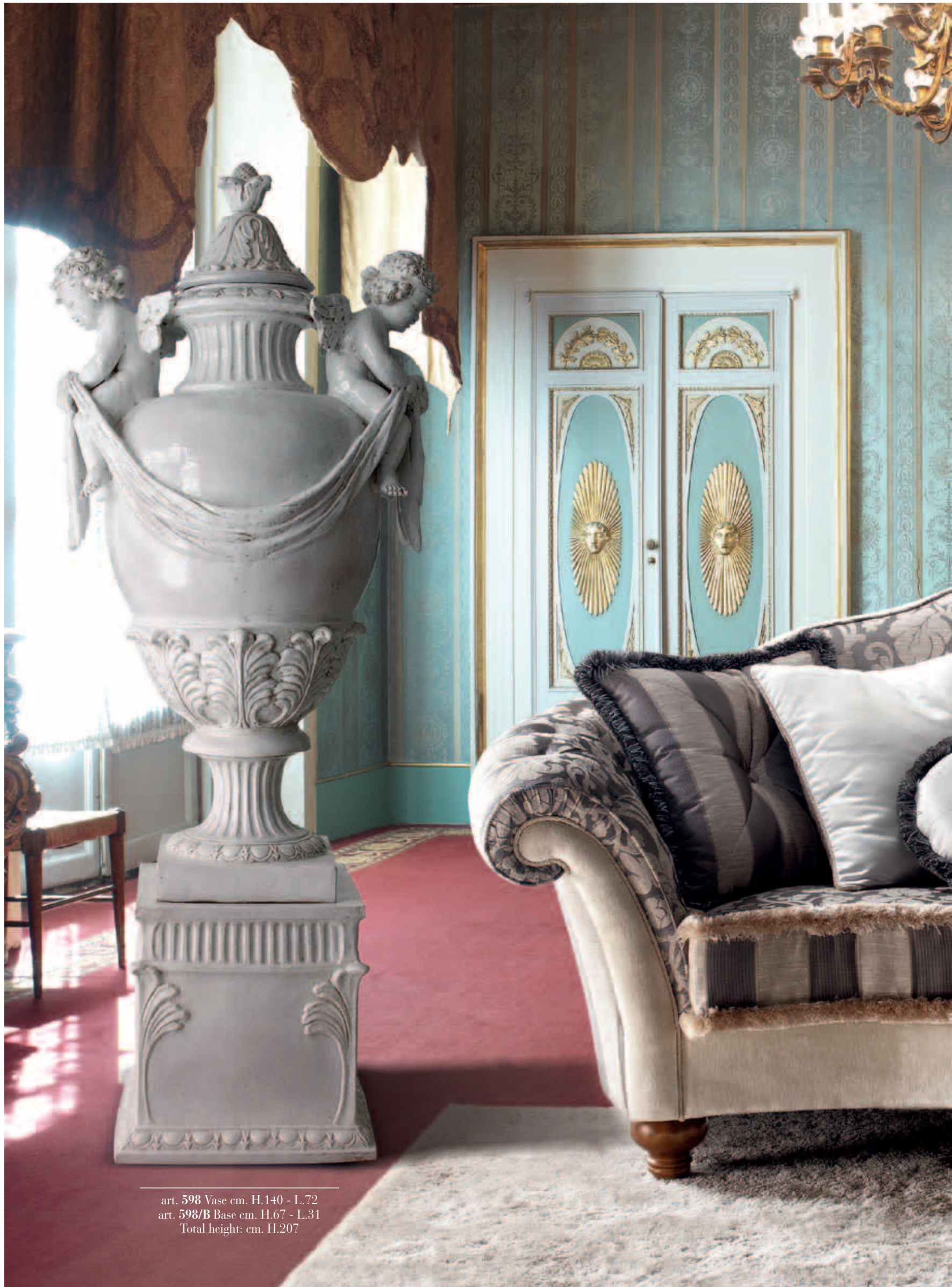
art. 598 Vase cm. H.140 - L.72 art. 598/B Base cm. H.67 - L.31 Total height: cm. H.207