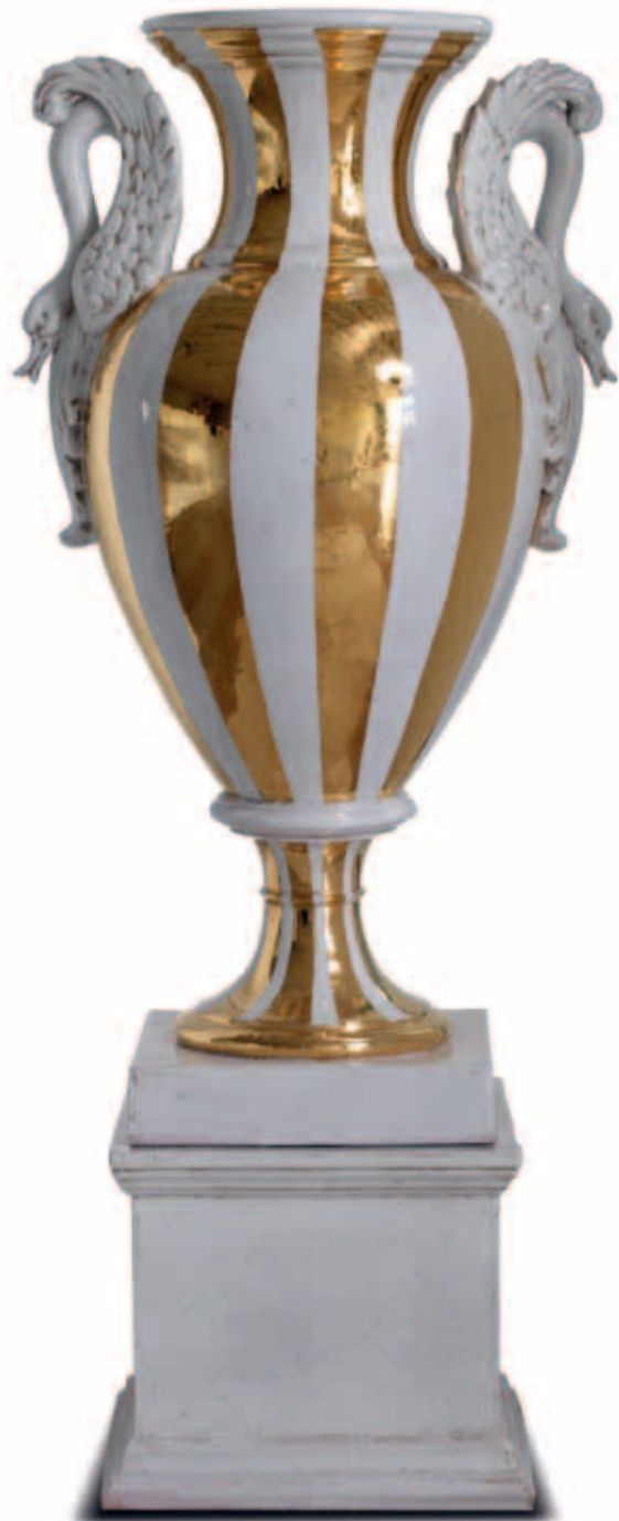
art. 451 Vase cm. H.100 - L.58 art. 451/B Base cm. H.32 - L.36 Total height: cm. H.132