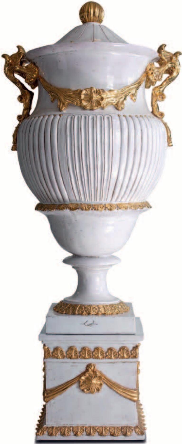
art. 704 Vase cm. H.155 - L.90 art. 704/B Base cm. H.50 - L.50 Total height: cm. H.205